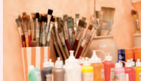
Blick in den Malraum

Einführung Tagesbetreuung für dementiell veränderte Bewohner:innen. Kunsttherapie für Pflegebedürftige. Gründung der »Stiftung Nikolaus-Cusanus-Haus«.