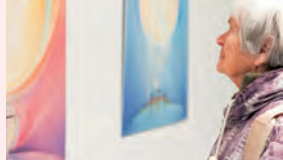
Bei einer Vernissage

Der erste Martinimarkt , organisiert von Bewohner:innen, findet statt. Erste gemeinsame Ausstellung von Bewohner:innen und Mitarbeitenden. Die erste Hauszeitung erscheint.