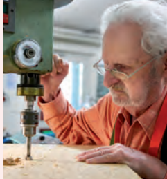
In der Werkstatt

Gründung des Unterstützungsfonds für Bewohner:innen. Einrichtung einer Werkstatt für Bewohner:innen.