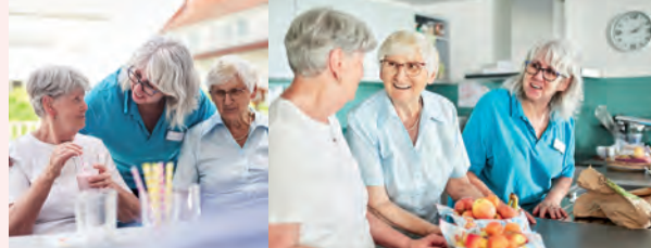
Wohngemeinschafts-Betreuung in Ostfildern

11. Juni: Eröffnung der Tagespflege in Birkach für täglich 15 zu betreuende Personen.