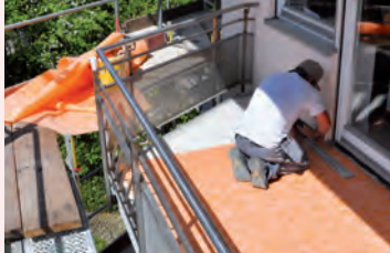
Balkon- und Fassaden-Renovierung

Abschluss der Sanierung von Balkonen und Fassade. Neues visuelles Erscheinungsbild mit Umsetzung in Hausprospekt, Hausjournal und Internetauftritt etc. Einführung Musiktherapie und Einzelbetreuung . Erweiterung des Ausbildungsangebots auf mindestens 12 Plätze pro Jahrgang.