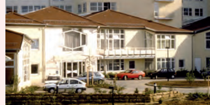
Der Eingangsbereich im Jahr der Eröffnung

3. Januar: Beginn des Innenausbaus . 8. Mai: Namensgebung »Nikolaus-Cusanus-Haus«. 14. Juni: Richtfest .