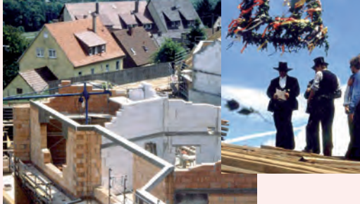
Rohbau und Richtfest

5. April: Grundsteinlegung . 17. November: erste Baubegehung mit künftigen Bewohner:innen.