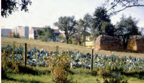
Baugrund in Birkach

Grundstücksverhandlungen und Abstimmung der räumlichen Gestaltung mit der Stadt Stuttgart. Ab Oktober Treffen mit Interessenten und zukünftigen Bewohner:innen . Zustimmung des Bezirksbeirates Birkach.